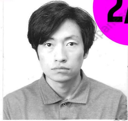
( 年 月 日撮影)